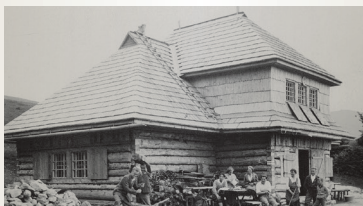
1928 – druhá Chata pri Kráľovej studni vypálena fašistami počas SNP, koncom roku 1944