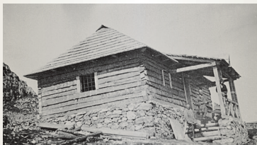
1927 – prvá Chata pri Kráľovej studni zhorela 18.9.1927, desať dní pred otvorením